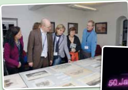
Lange Nacht der Wissenschaften am 29. April 2010