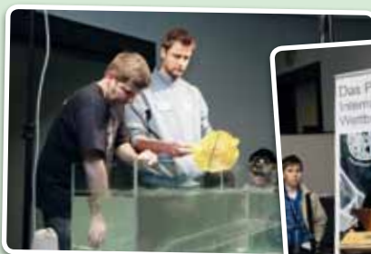
14. Papierschiff-Wettbewerb der Universität Rostock am 7. Mai 2010