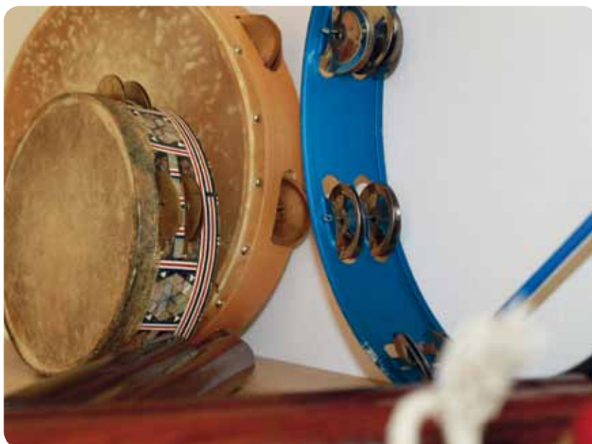
Elementare Musikinstrumente im Musiktherapieraum

Musik berührt. Musik wirkt. Musik im Rahmen der therapeutischen Beziehung gezielt zur Wiederherstellung, Erhaltung und Förderung seelischer, körperlicher und geistiger Gesundheit einzusetzen, ist das Wesen der Musiktherapie. Als tiefenpsychologisch fundierte Spezialtherapie wurde diese Therapieform im Jahr 2003 in das psychotherapeutische Gesamtkonzept der Klinik und Poliklinik für Psychosomatik und Psychotherapeutische Medizin an der Universität Rostock integriert. Die Therapie zielt darauf, geistige, psychische oder körperliche Leiden bei Patienten mit Hilfe der Musik fühlbar und bewusst zu machen, um dadurch eine Heilung zu unterstützen.