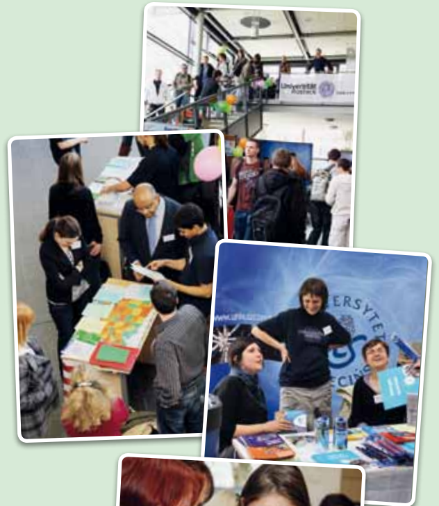
Internationaler Tag am 28. April 2010