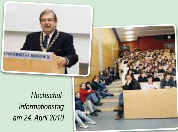
Hochschul- informationstag am 24. April 2010