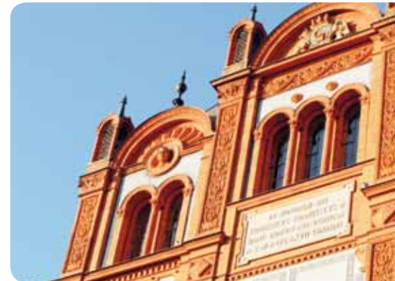
Erfolgsgeheimnis einer fast 600 Jahre alten Universität: traditio et innovatio

Audi, Bayer, Biotronik, Bosch, Caterpillar, Cisco, Dell, Diehl Aerospace, Erdtebrücker Eisenwerke (EEW), Fresenius, Fujitsu, Infineon, Intel, Liebherr, Lufthansa, Mercedes Benz, Nordex, Nordic Yards, Novartis, Pfizer, Sanofi Aventis, Siemens, Sun, VW