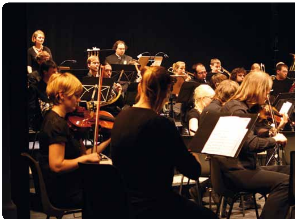
Das Freie StudentenOrchester Rostock e. V. während des Benefizkonzerts am 28. Februar 2010

Im Herbst feiert das FSOR sein fünfjähriges Bestehen, das selbstverständlich mit einem Jubiläumskonzert begangen wird. Gern möchte ich die Kooperationen mit anderen Ensembles der Stadt