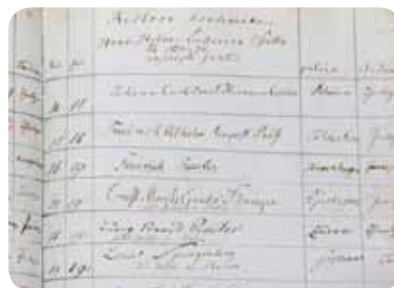
Matrikeleintragung Fritz Reuters vom 19. Oktober 1831

Im Jahre 1863 arbeitete Fritz Reuter an seinem größten Roman. Als niederdeutscher Schriftsteller befand er sich auf der Höhe seines Schaffens. Aus Anlass der 50-jährigen Befreiung von Napoleon und mit Bezug auf sein Werk „Ut de Fran-