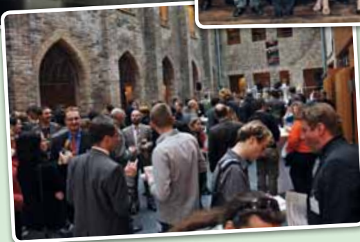
Prämierung des VentureCup-MV 2010 am 7. Mai 2010