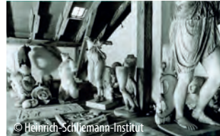
Zustand vor 1998