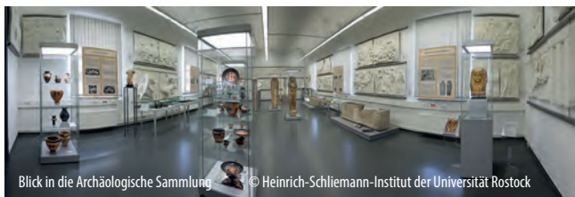
Blick in die Archäologische Sammlung

Die Abguss-Sammlung Antiker Plastik umfasst derzeit knapp 200 Skulpturen, die ab Oktober 2018 an ihrem neuen Standort in der Jakobi-Passage präsentiert werden.